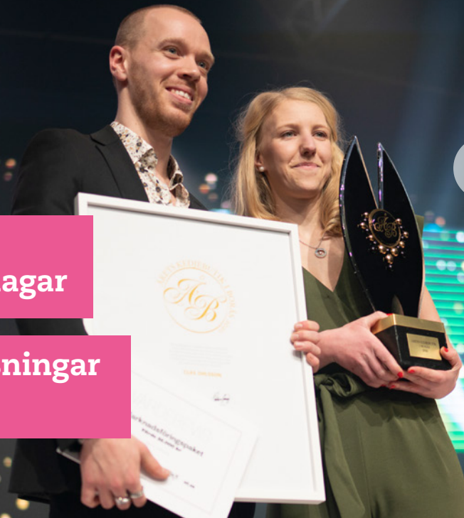
Årets kedjebutik: Clas Ohlson

Lyckade logistiksatsningar tar nästa steg