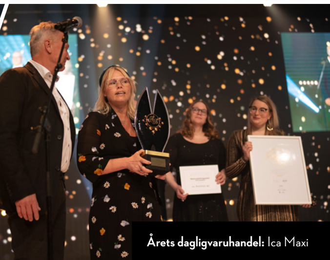
Årets dagligvaruhandel: Ica Maxi