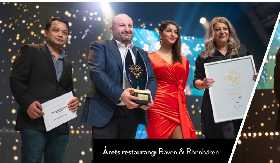
Årets restaurang: Råven & Rönnbären