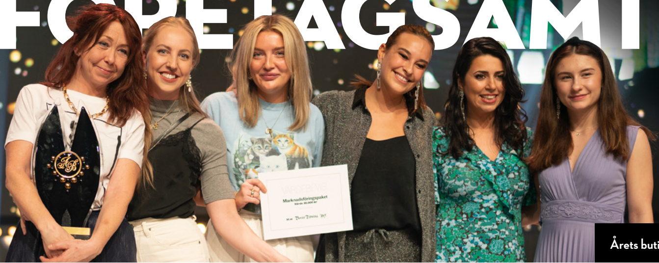
Årets butik: Veras